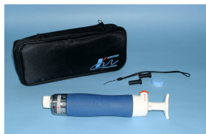
北川式ガス採取器